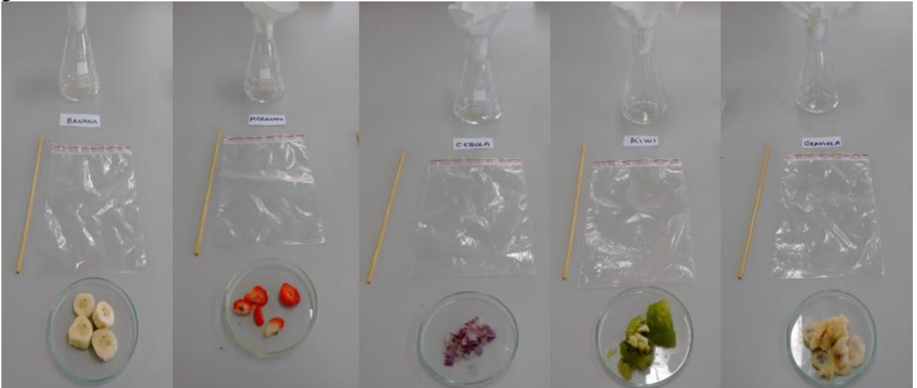
Figura 1: Amostras das cinco plantas utilizadas na pesquisa: morango, banana, cebola, kiwi e graviola.