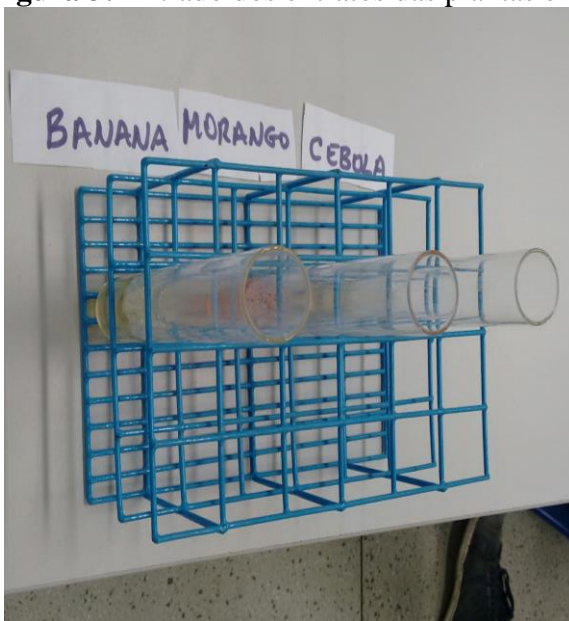
Figura 3: Filtrado dos extratos das plantas em repouso por 15 minutos.

Dos resultados obtidos a partir das observações feitas nas soluções que estavam contidas nos vários tubos de ensaio, verificou-se que o material extraído da graviola apresentou concentração de DNA em quantidade satisfatória, assim como as demais plantas utilizadas nesse experimento (Figura 3).