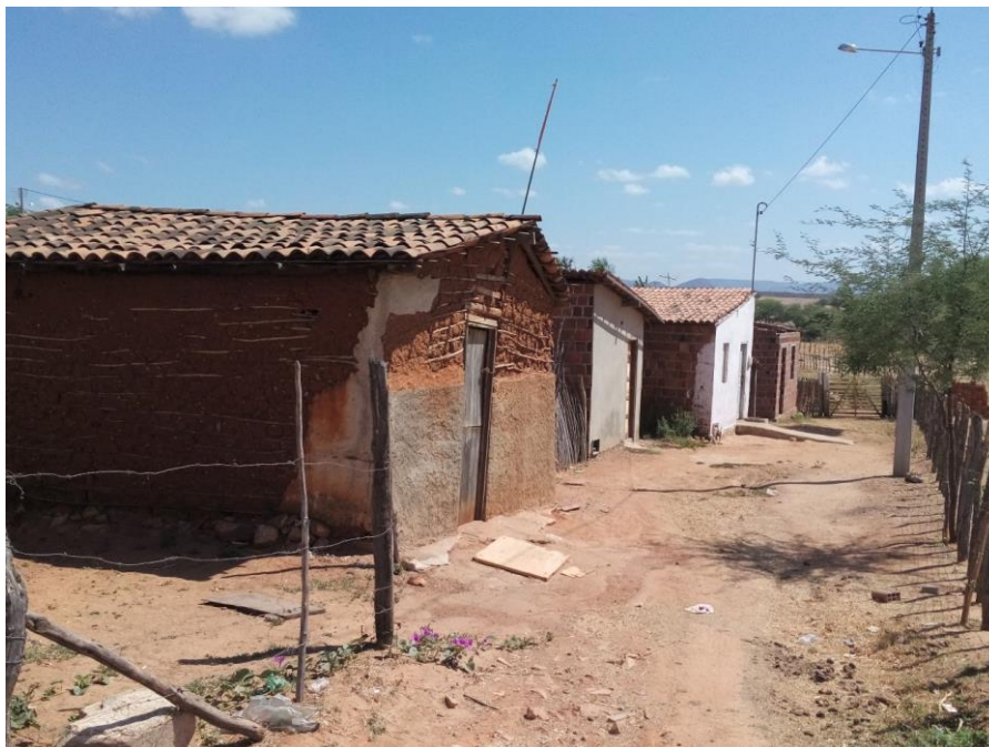
Figura 2 - Casas de taipa no Bairro Manoel Deodato, em Pau dos Ferros/RN