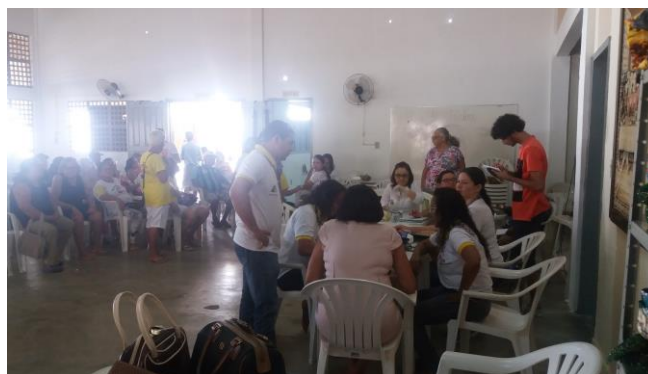
Figura 2 Realização de Consultas Médicas feitas pelas equipes de saúde do bairro no CCI