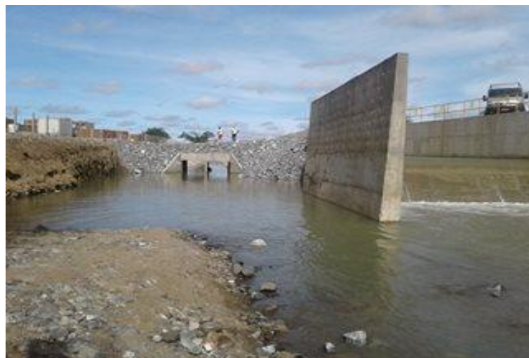
Figura 4 – Canal pluvial construído como forma de “bloqueio” entre o esgoto e as águas do Rio São Francisco

Segundo explicações do engenheiro durante a análise de campo na cidade de Monteiro foi necessário a realização de obras para desviar a água do Rio São Francisco dos efluentes produzidos pela população (Figura 4 e 5), obra que estava sob responsabilidade do Estado, porém quando chega no trecho que compreende ao Rio Paraíba há o encontro dos efluentes com as águas, ocasionando poluição e inviabilidade para consumo humano, este problema é resultante da falta de gestão.