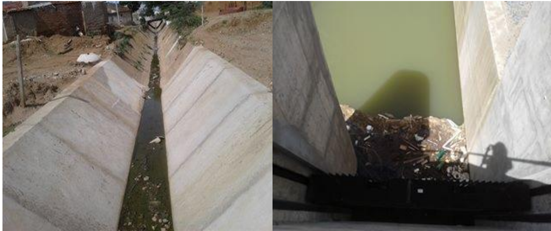
Figura 5- Efluentes no canal pluvial