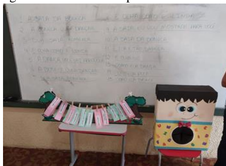
Imagem: 4 - Os versos expostos e escrito no quadro