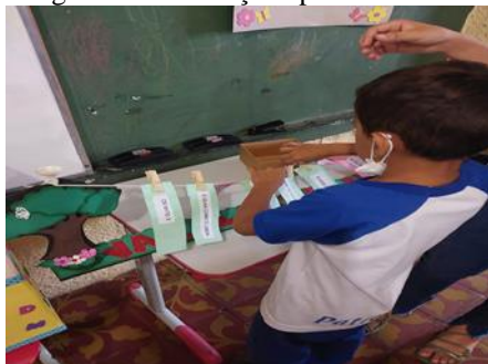
Imagem:3 - A criança expõe o verso lido