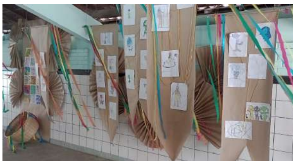
Imagens 10 e 11. Dispositivos expositivos para fruição da comunidade escolar.