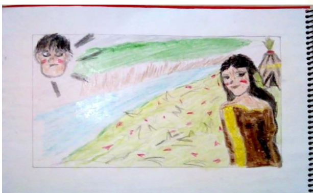
Imagens 2, 3, 4, 5 e 6: detalhes da cartilha.

Você já ouviu sobre a lenda dessa raiz? Então vamos ler?