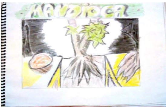
Imagem 1: capa da cartilha mandioca

A seguir, apresentamos algumas imagens da cartilha para que o leitor possa visualizar a capa, seguida de algumas atividades. O trabalho consistiu em dispor os textos juntamente com os desenhos e as atividades realizadas, que foram desenhadas em diferentes tons de cinza (grafite), cortadas, coladas em papel cartão e encadernadas.