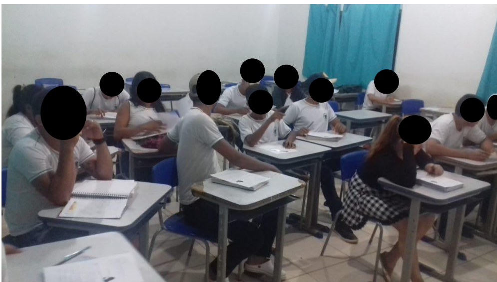
Figura 1. Aplicação da atividade

Em relação ao contexto vivenciado em nossa atuação durante a aplicação da atividade, percebemos que, ao realizarem a atividade em equipe, os alunos refletiam acerca de conhecimentos teóricos adquiridos, demonstrando de forma participativa que a atividade estava contribuindo com eles da maneira que eles mais gostam, através da diversão (Figura 1).