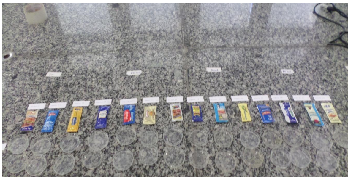
Figura 1: Imagem das 14 amostras de maionese utilizadas na pesquisa.

Foram adquiridas 14 marcas de maionese, em forma de sachês, no comércio de Campina Grande-PB. As amostras foram levadas ao Laboratório de Biologia do Instituto Federal (IFPB) – Campus Campina Grande, no dia 29 de maio de 2019 (Figura 1).