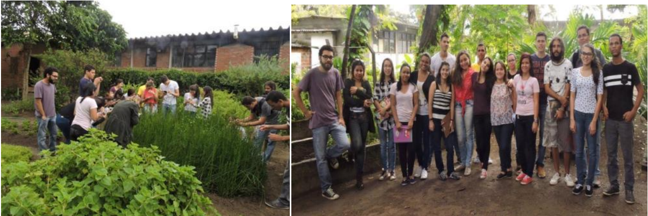
Figuras 3 e 4: excursões pelo campus.

daquele exemplar de forma a caracterizar sua família. Devido à grande quantidade de alunos, eram os tutores encarregados de tirar dúvidas e esclarecer alguns caracteres dos exemplares, de forma que o professor podia continuar com a explicação e não havia a necessidade de ser interrompido. Em algumas ocasiões eram coletadas amostras de indivíduos e levados de volta ao Laboratório de Botânica para que os alunos pudessem observar melhor as estruturas (inclusive nas lupas) e determinar as famílias em questão.