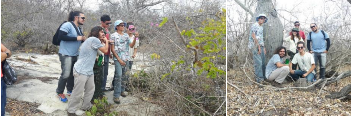
Figuras 7 e 8: excursão na Fazenda Almas.