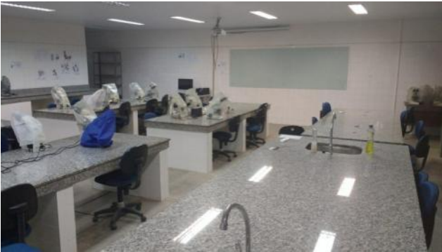
Figura 1: laboratório de Botânica.

O laboratório de Botânica (LDB) está situado na Universidade Federal da Paraíba, campus João Pessoa, no Centro de Ciências Exatas e da Natureza (CCEN), Departamento de Sistemática e Ecologia (DSE). Neste laboratório são efetuadas tanto as aulas teóricas como as práticas, visto recursos para ambas as atividades. O laboratório tem capacidade para 40 alunos e possui lupas e microscópios para observação das estruturas morfológicas e anatômicas, além de projetor multimídia e bancada. Possui ainda exemplares da coleção botânica da Universidade, que consiste de exsicatas, banco de sementes e herbário em geral.