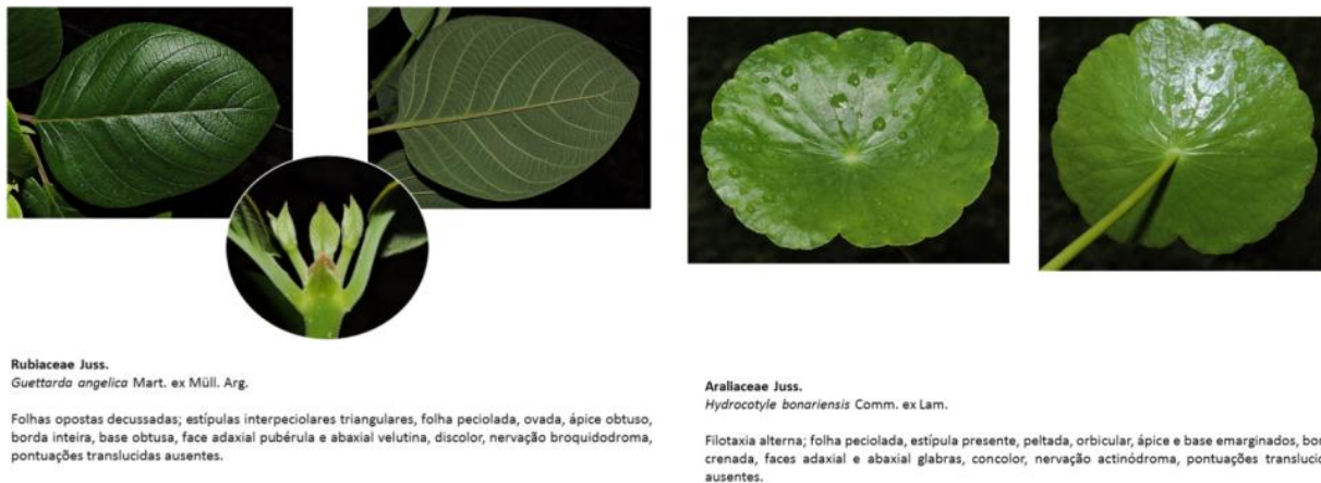
Figuras 15 e 16: exemplos de partes do Guia de Folhas.

As plantas foram coletadas e herborizadas e os procedimentos baseados em Judd et al. (1999). Informações relevantes à posterior identificação, como coloração de estruturas reprodutivas, hábito e outras, foram anotadas quando das coletas. Fotografias foram tiradas para inserção no guia. Após isso, a identificação se deu através de literatura especializada na área de Botânica (Gonçalves & Lorenzi, 2011; Souza, Flores & Lorenzi, 2013); os nomes válidos das espécies e dos autores foram consultados no website The PlantList (2016) e a lista final baseada na proposta do APG III (2009). Tal guia está em processo de publicação, de forma a consolidar o conhecimento da flora paraibana e nordestina.