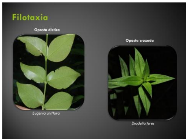
Figura 13: parte da apostila: filotaxia.

Ao final da apostila encontra-se ainda um índice com significado das palavras (principalmente estrangeiras) utilizadas na apostila. Encontram-se ainda ao final as referências. Este material foi divulgado para os alunos da disciplina através de email pessoal e da turma, estando assim disponível para todos.