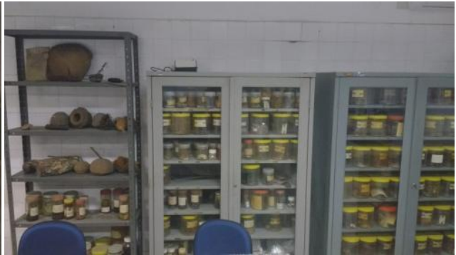
Figura 2: mini-herbário didático.