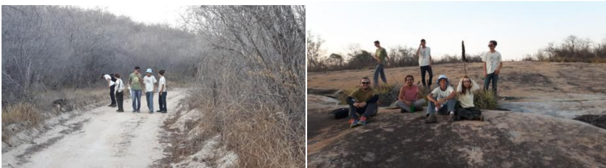
Figuras 5 e 6: excursões na Fazenda Almas.

Visto a necessidade de ter contato com plantas que de fato somente ocorrem na Caatinga, foram realizadas excursões para a Reserva Particular do Patrimônio Natural Fazenda Almas, localizada na cidade de São José dos Cordeiros (PB). Este ambiente possibilita a proximidade com o ecossistema característico da Caatinga, com vegetação típica. A visita se dava através de trilhas, onde o professor ministrava conteúdo a partir do contato com a flora local. Nestas ocasiões estavam os tutores engajados na ajuda para identificar as famílias e espécies botânicas, assim como tirar eventuais dúvidas dos alunos.