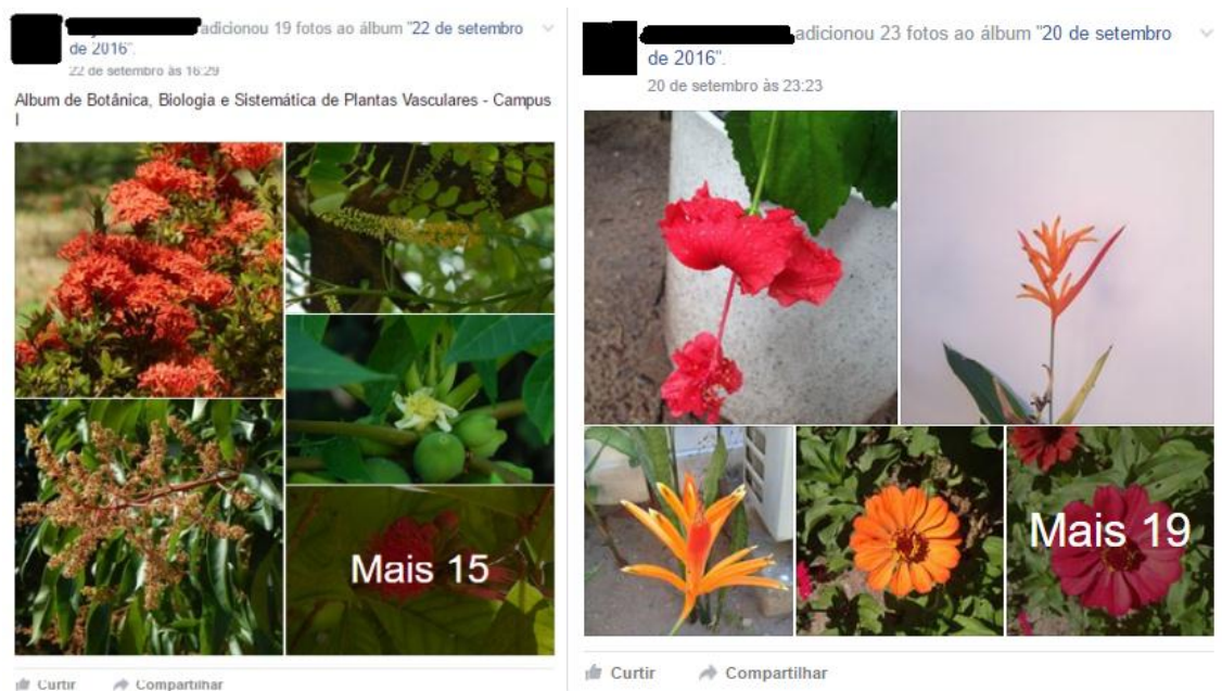
Figuras 11 e 12: postagem dos trabalhos dos alunos no grupo do Facebook da UFPB.

Por vezes, como exercício, era passado pelo professor para os alunos que coletassem certas famílias de plantas e posteriormente descrevessem-nas e identificassem-nas. Em outras ocasiões, lhes eram solicitados também à captura de fotografias de plantas do campus, seguidas de identificação de estruturas e da espécie, e posteriormente sua postagem no grupo do Facebook da Universidade Federal da Paraíba a fim de divulgar o conteúdo florístico do campus para outros estudantes da Universidade. Eram disponibilizados horários pelos tutores seis dias por semana (o curso de Ciências Biológicas modalidade licenciatura possui sábados letivos) para que os alunos da disciplina tirassem eventuais dúvidas a respeito da descrição das plantas e dúvidas gerais sobre a disciplina.