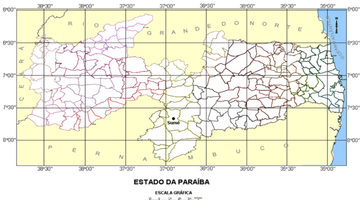
Figura 1 – Localização do município de Sumé no Semiárido paraibano

A pesquisa foi realizada em uma área serrana no município de Sumé (Figura 1), na microrregião do Cariri Ocidental da Paraíba, nas coordenadas geográficas de 07°40'18" de Latitude Sul e 36°52'48" Longitude Oeste. Segundo o IBGE, sua população estimada em 2016 foi de 16.872 habitantes, com a área territorial de aproximadamente 838,071 km 2 e densidade demográfica, em 2010, de 19,16 hab/km 2 .