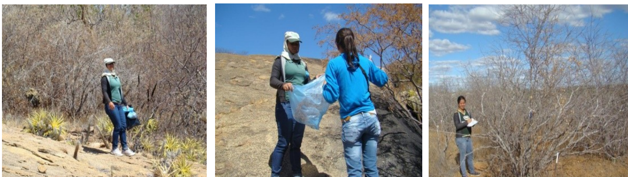
Figura 2 - Coleta de material em uma área de vegetação serrana no município de Sumé, Cariri paraibano.

Para o estudo da riqueza florística, realizou-se um caminhamento exploratório na área serrana, no mês de julho de 2016, onde foi efetuado o registro de ocorrência das espécies e coleta de material fértil para posterior prensagem e herborização (Figura 2).