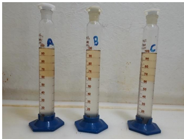
Figura 3 - Determinação do teor de etanol anidro combustível nas amostras de gasolina tipo C