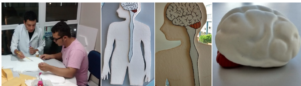
FIGURA 1 – Modelos permanentes desenvolvidos pelos bolsistas do PBID biologia UNIFACEX.

Após a sondagem, foram realizadas aulas expositivas e dialogadas, bem como rodas de conversas, sendo discutidos conteúdos sobre os componentes do sistema nervoso Central e periférico e suas respectivas funções e diferenças. Para melhor compreensão sobre a anatomia desse sistema, foram confeccionados pelos bolsistas do projeto modelos permanentes do sistema nervoso, sendo 02 protótipos de isopor, com os órgãos do sistema nervoso em relevo e destaque, e 01 modelo de cérebro e cerebelo feito de biscoit, onde estes tinham como objetivo criar um maior contato dos discentes com as estruturas do sistema, para que estes pudessem tocar e a sentir de uma maneira representativa o encéfalo humano, bem como permitir aos alunos utiliza-lo como base de instrução para a construção de seus próprios modelos (Fig. 1).