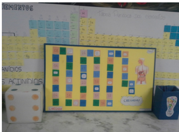
FIGURA 01 – Jogo de tabuleiro utilizado.

No quarto momento a turma foi dividida em quatro grupos, cada um responsável pela confecção de desenhos esquemáticos e descrição das características morfofisiológicas de órgãos específicos do sistema digestório (Figura 02). No quinto momento realizamos uma exposição dos materiais e ações desenvolvidas ao longo do projeto utilizando apresentação de slides, amostra de vídeos e fotografias. Em seguida os discentes refletiram e compararam metodologias tradicionais utilizadas pela docente habitual de sala de aula com as metodologias alternativas de ensino desenvolvidas no presente projeto ambas abordando a mesma temática.