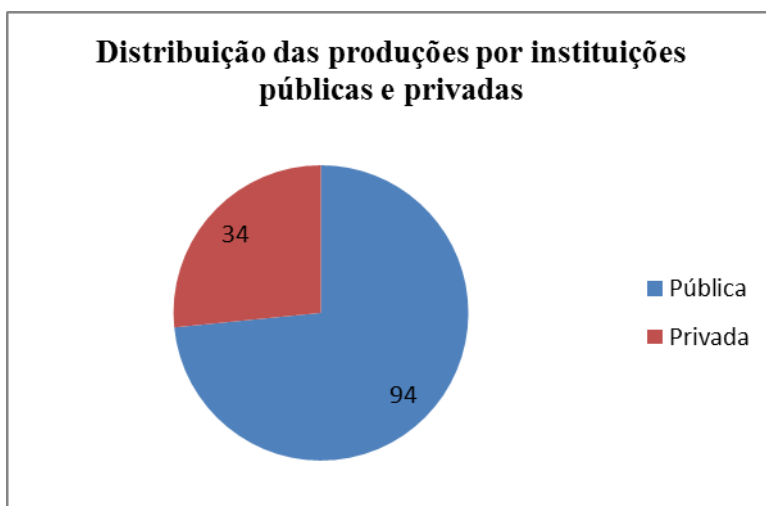
Gráfico 2 – Distribuição das produções por instituições públicas e privadas