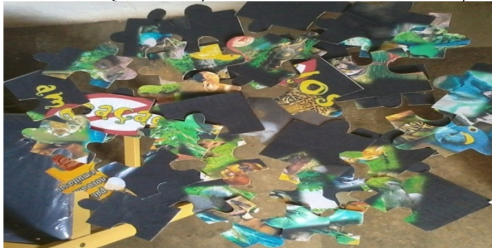
FIGURA 1: Quebra-cabeças com o tema “Animais em Extinção”