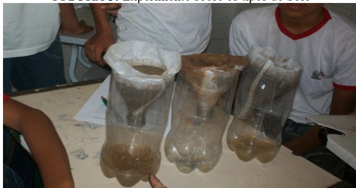
FIGURA 3: Experimento sobre os tipos de Solo

papel filtro em cada funil, em seguida, depositaram em cada funil um tipo de solo diferente; pondo as três juntas, os alunos despejavam a mesma quantidade de água nas garrafas e aguardavam 2 minutos, por fim, marcavam a quantidade de água que descia em cada garrafa como podemos observar.