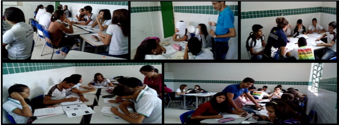
Figura 2 – Desenvolvimento da oficina sobre a orientação dos bolsistas do PBID/UEPB.