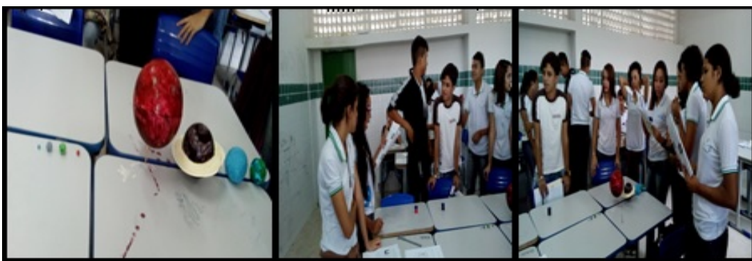
Figura 3 – Conclusão da oficina

Finalizamos a oficina, com a montagem do sistema solar reduzido, e em seguida pedimos aos estudantes que realizassem apresentações das características de cada planeta do sistema solar, como: a formação do planeta, o seu diâmetro e a sua distância ao Sol, entre outras, disponíveis no material didático elaborado como apoio. Na Figura 3 podemos observar a montagem e momento da apresentação dos alunos.