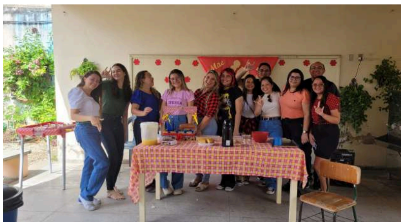
Dados da autora (2024)