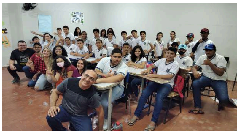
Dados da autora (2024)