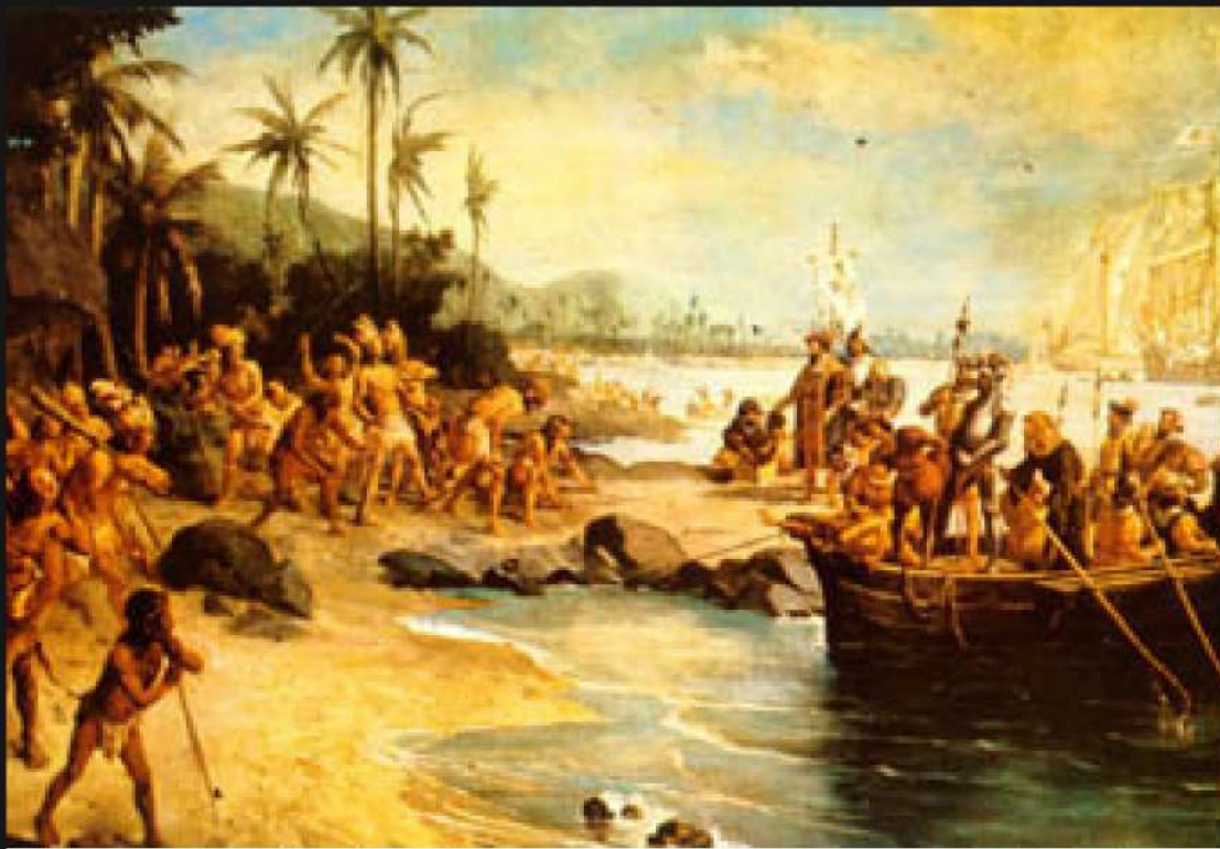
Oscar Pereira da Silva, Desembarque de Cabral em Porto Seguro, SP, Museu Paulista

Os Livros didáticos ainda são a principal fonte de informações e conteúdos utilizados nos ambientes educacionais do Brasil atual, entretanto, será que de fato o textos, imagens e apresentações em que neles estão presentes condizem com os avanços informativos das questões afro-brasileiras e indígenas?