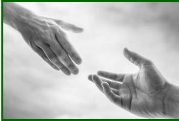
Imagem 1- A cura: Após a cura, vem a responsabilidade de ser testemunho vivo.